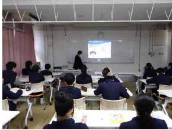
興味津々の生徒達に授業を行う講師