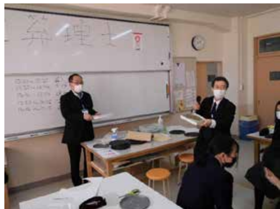
発想力豊かな生徒達と工作を行う講師