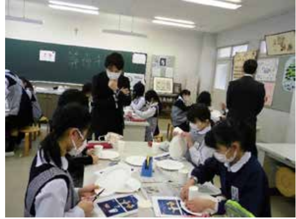
発想力豊かな児童達と工作を行う講師