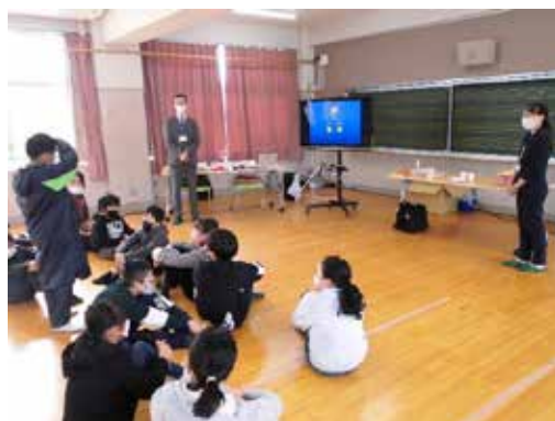
興味津々の児童達に講義を行う講師