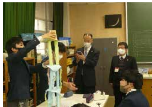
発想力豊かな生徒達と工作を行う講師