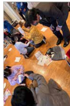
（授業風景、小学生たちの作品）