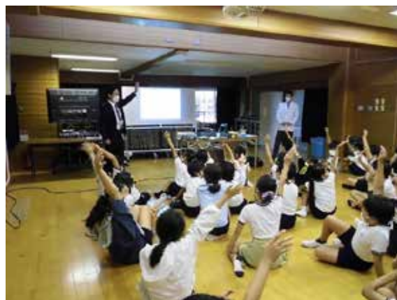
興味津々の児童達に講義を行う講師