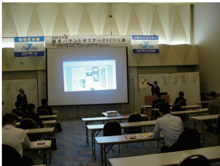
ポスターセッション2の様子