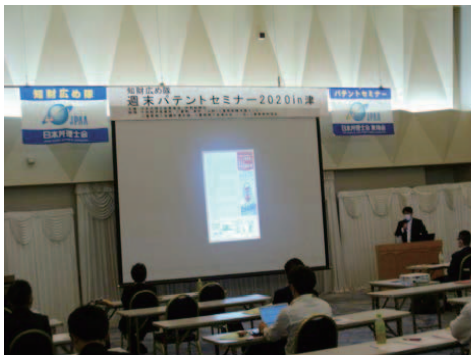
ポスターセッション3の様子