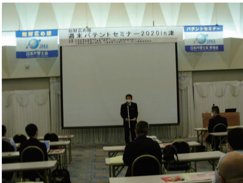
伊勢新聞社代表取締役社長 挨拶