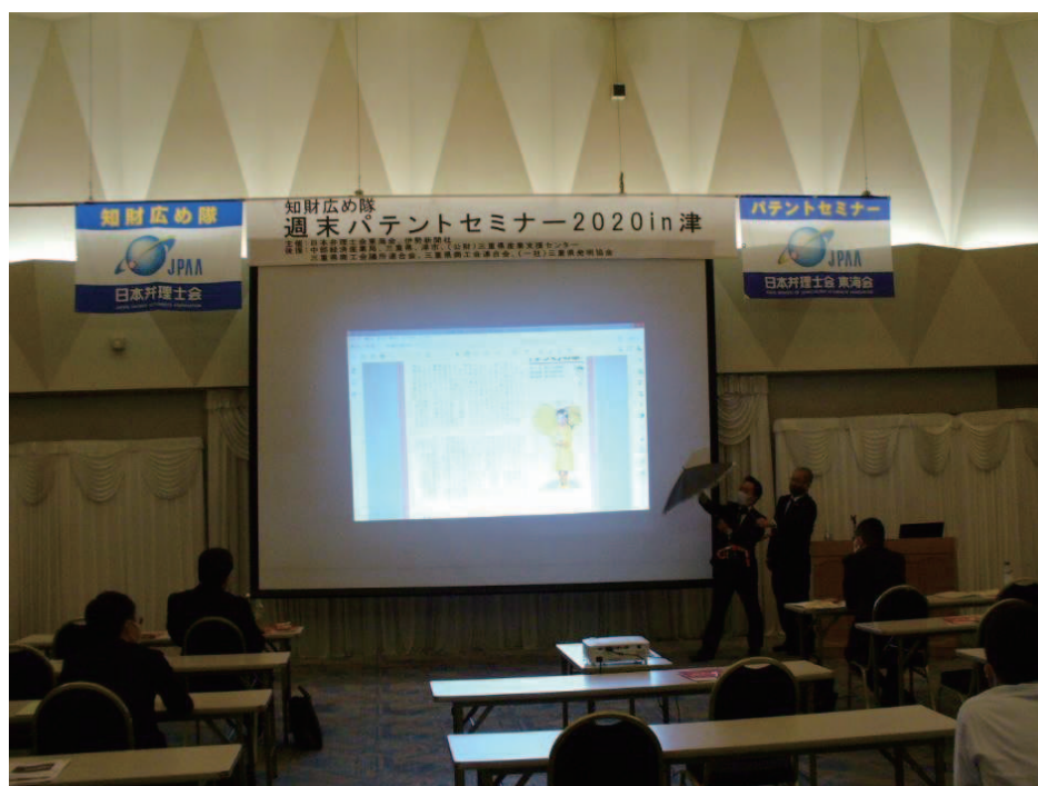
ポスターセッション1の様子