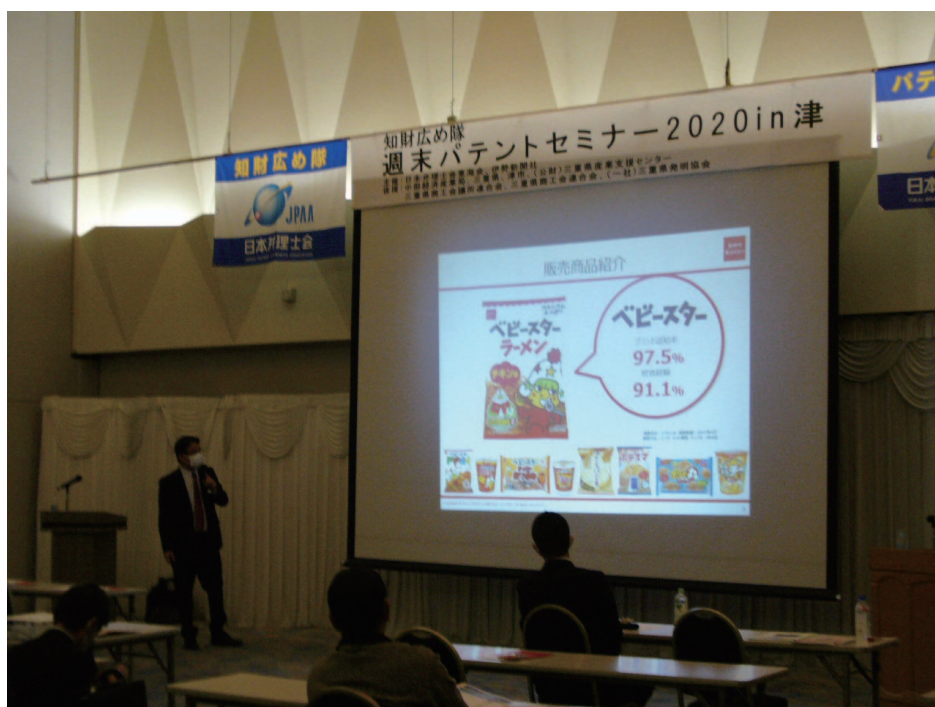
セミナー第1部の様子