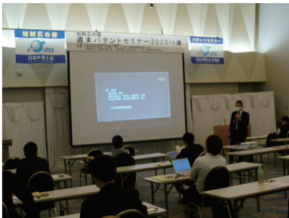
セミナー第2部の様子