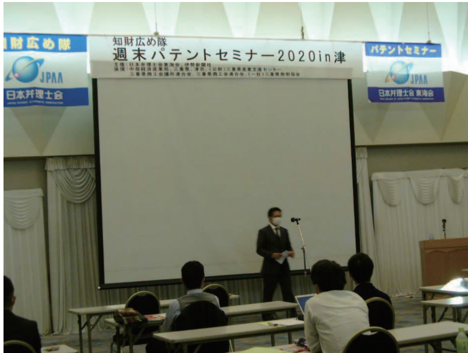
日本弁理士会東海会会長 挨拶