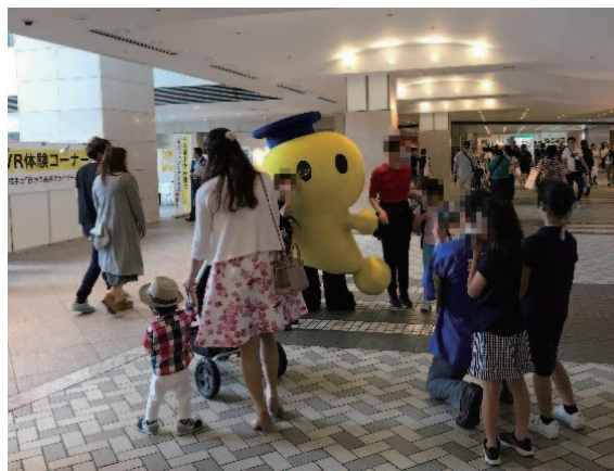
「はっぴょん」との写真撮影の様子