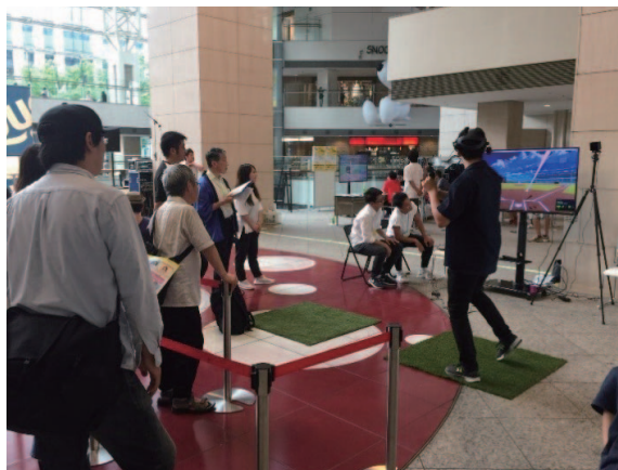
eスポーツ体験及びVR体験コーナー