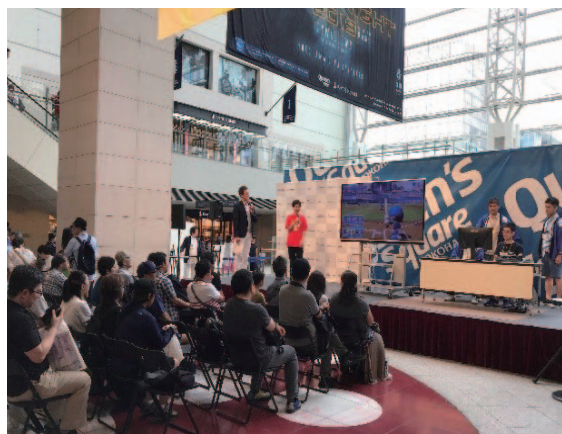
e スポーツプロプレイヤーによるパワプロ実演