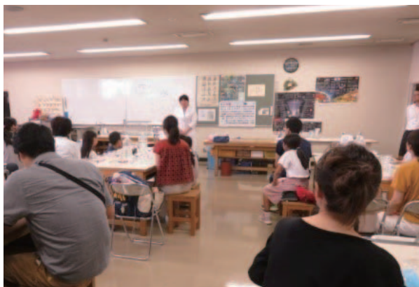
(兵庫地区会) 会場の様子