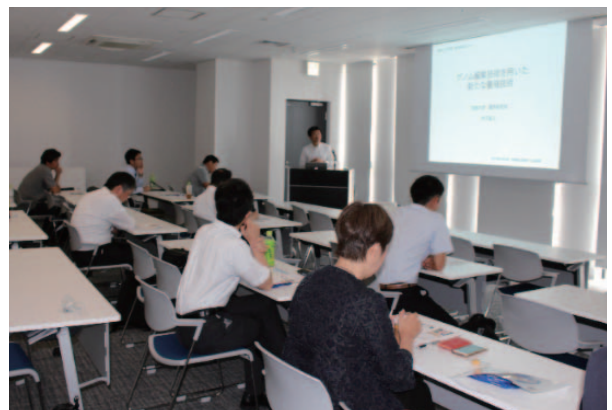
(京都地区会) 会場の様子