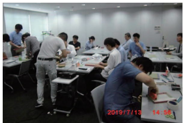
(奈良地区会) 会場の様子