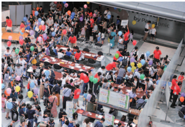
(関西会・大阪) イベント会場の様子