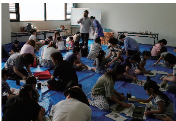
(滋賀地区会) 会場の様子