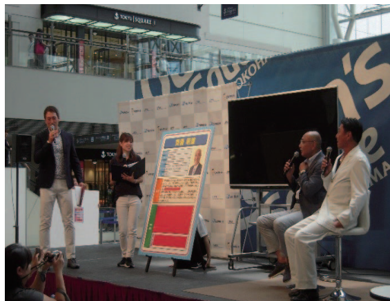
元プロ野球選手の齊藤明雄氏・池山隆寛氏によるトークショー