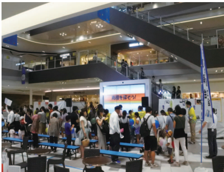
イベント「商標を探そう！」の様子

か所のみでなく、工作のみ等、規模を縮小した形で東海会管轄県内のより多くの地域で実施することで、地域全体での知的財産制度の普及と啓発は図るべく、徐々に新たな試みも実施しております。