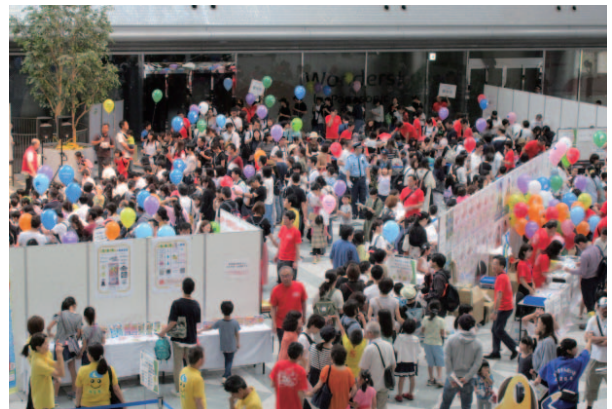
(関西会・大阪) イベント会場の様子