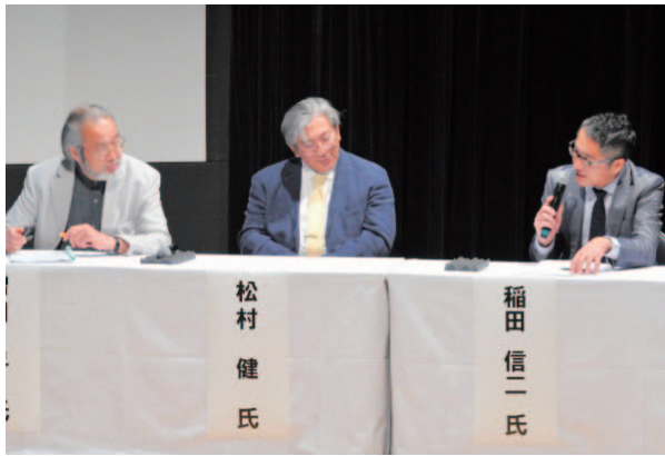
(関西会・大阪) 講演会 質疑応答