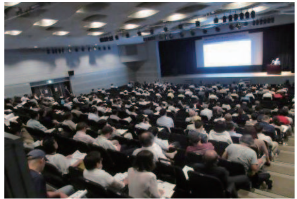
(関西会・大阪) 講演会 会場の様子