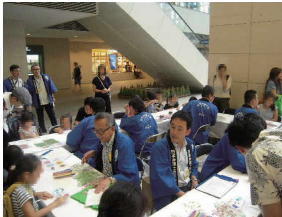
オリジナルうちわ作成コーナー