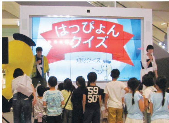
弁理士の日記念フェスタ

一般市民への弁理士の周知を図るため、7／13（土）に「弁理士の日記念フェスタ」を名古屋地区で実施しました。今年は、東三河地区、三重地区などで「弁理士の日記念」のミニイベントも試行し、各地において一般市民への弁理士の周知を図ります。