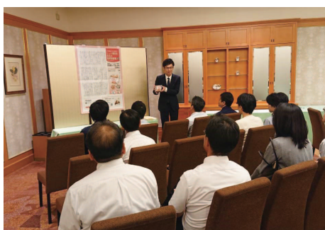
ポスターセッションの様子