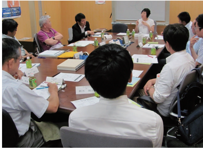
知的財産経営サロン

中小企業の出展／来場者の多い「しんきんビジネスマッチングフェア」（名古屋）などの展示会へ出展し、弁理士をアピールします。