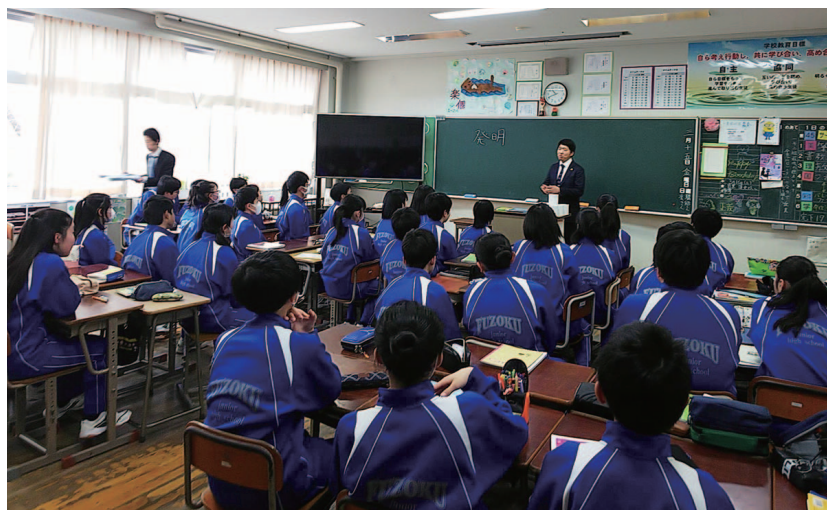
知財創造教育 工作授業「ペーパータワー」

最後となりますが、会員の皆様には、東北における弁理士会の復興支援活動にご理解及びご協力を賜り、心より感謝申し上げます。