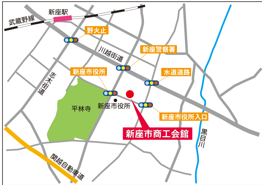
埼玉県新座市野火止1-9-62