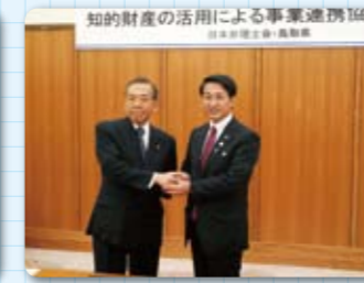
▲鳥取県「支援協定締結式」