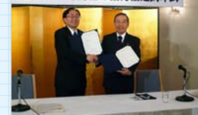
▲青森県「支援協定締結式」