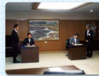
▲熊本県「支援協定締結式」