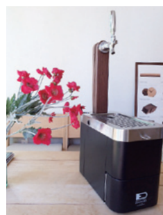
(株)エムトリップコーポレーション (どこ生)