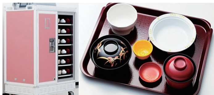
(株)下村漆器 (フードカート+食器セット)