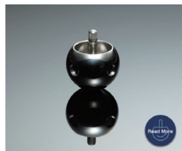
(株)西村金属 (逆さこま)