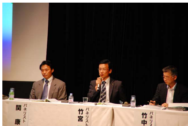
パネルディスカッションの様子