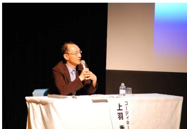
パネルディスカッションの様子