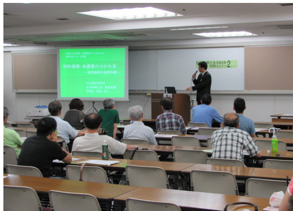
「知財セミナー2」講演の様子