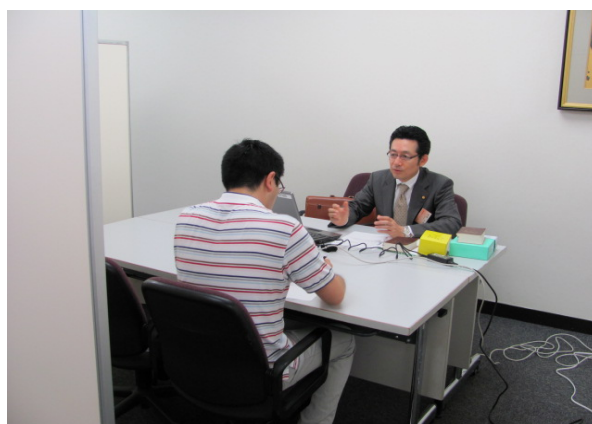
無料知的財産相談会の様子