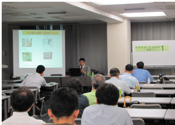
「知財セミナー1」講演の様子

当日は雨天にもかかわらず延べ196名の参加でしたが、天候に影響してか、例年よりも来場者数は若干低調でした。