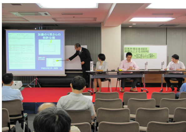
「知財セミナー1」紛争劇の様子