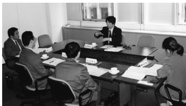
インタビュー風景

知財で地域貢献する会社の仕事は、弁理士業務のニーズを掘り起こすことにもつながっている。氏の仕事のスタイルは、地方都市における弁理士業務の可能性の大きさを示唆するものでもある。